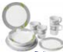
Geschirrset für 4 Personen*