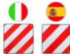
Warntafel Italien oder Spanien