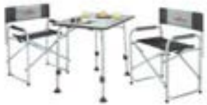
Campingmöbel Set Tisch und 4 Stühle